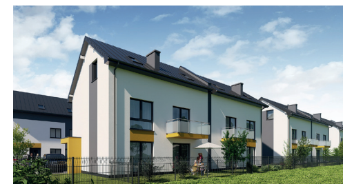
Widok osiedla od strony ogrodu

2 – poziomowy lokal o dużej przestrzeni do łatwej aranżacji