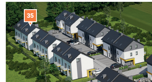
Widok osiedla z lotu ptaka